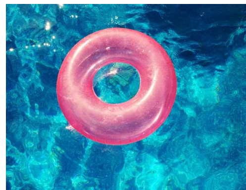
Swimming ring 水泡/游泳圈