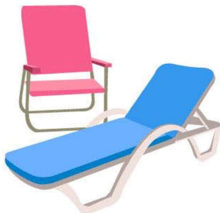
Beach Chair 沙灘椅