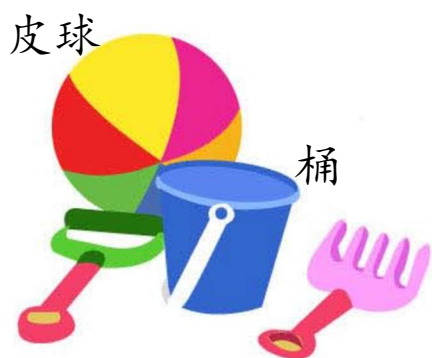
Beach Toy 沙灘玩具