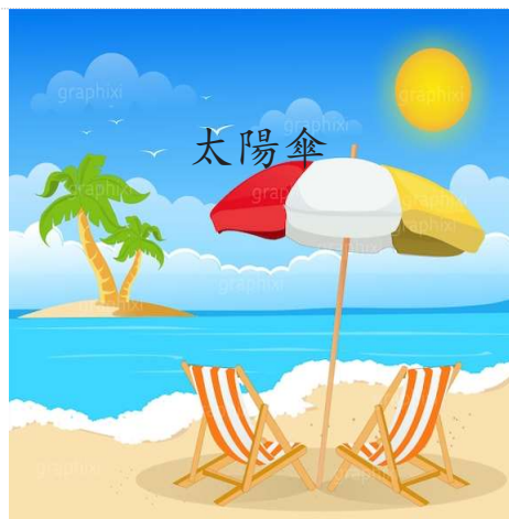
Beach 沙灘/ 海灘